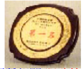
優質報關 服務第一

您好！很不好意思，於您百忙的業務中，佔用您數分鐘，容晚輩介紹敝號之優質報關業務，希望於您詳讀完後，能有機會為您一年節省下數十萬之報關費用開銷。