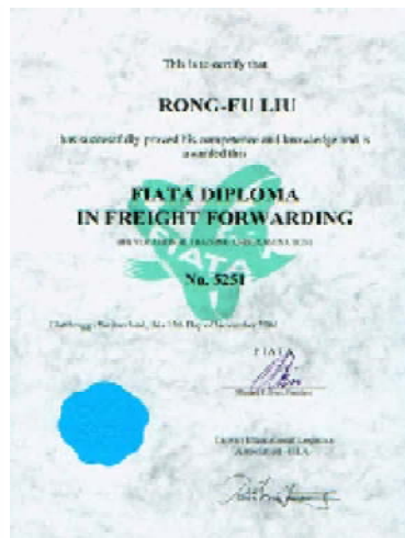
聯合國FIATA海運運送組織全球第5251號專業技師執照