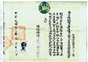
報關專業技師執照