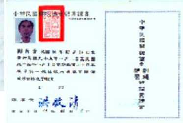
保稅業務專員執照