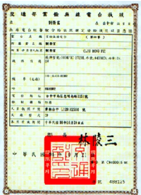
交通部業餘無線電台執照