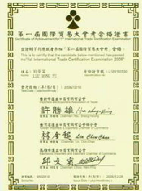
國貿會考合格證書