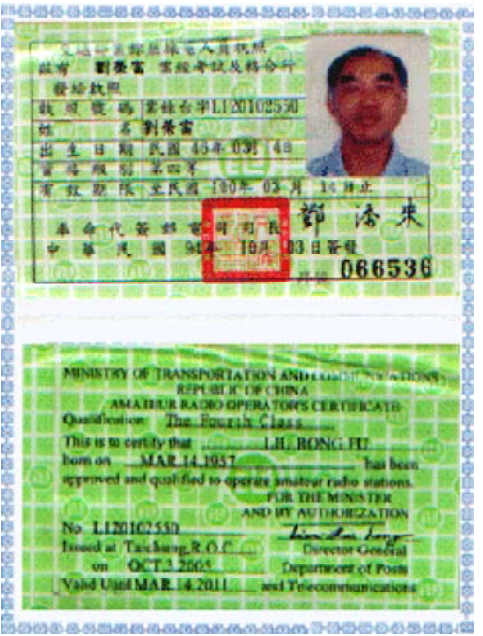
交通部業餘無線電專員及格證書

~~ 營業特色:知識經驗最豐富,文件最精美,全台灣報關費最便宜,送件速度最快,服務最親切。~~~