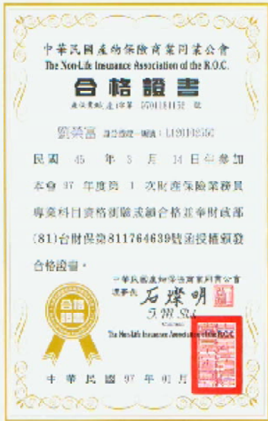
產物保險業務員合格證書