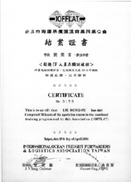
海攬公會操作專員證書